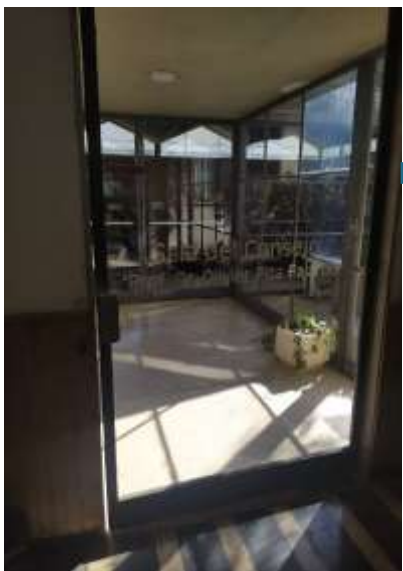
→ Sala del Consejo