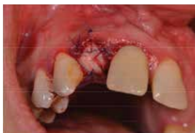
Fig. 3. Preservación alveolar e implante diferido