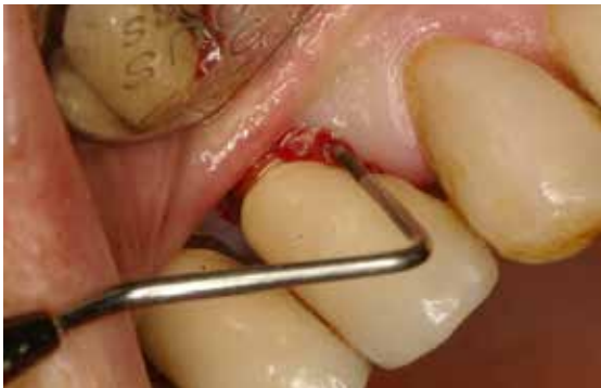
Fig. 5. Sangrado al Sondaje y/o supuración

Como en toda patología, el correcto diagnóstico es fundamental para establecer un adecuado tratamiento. Los parámetros a tener en cuenta son: el Sangrado al Sondaje y/o Supuración (SS) (Fig. 5) y Profundidad al Sondaje (Fig. 6) aumentada con respecto al examen inicial y control radiográfico. Otros métodos de diagnóstico aportan poca información, son más costosos y complejos de realizar.