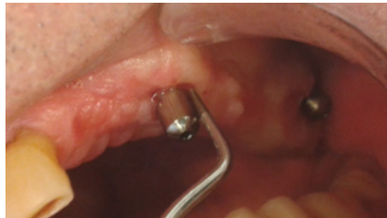
Fig.6. Profundidad de Sondaje

condiciones de la mucosa peri-implantar durante la terapia periodontal de apoyo, reveló que el sangrado en un mismo sitio, en más de la mitad de las visitas de mantenimiento, durante un período de 2 años se relaciona con el progreso de la enfermedad (6) .