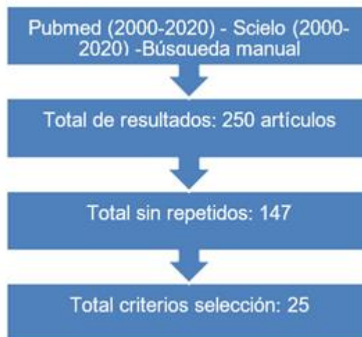
Fig. 1: Flujoograma de selección de artículos

Los datos fueron extraídos de forma independiente empleando como herramienta de recogida de datos la tabla 1.