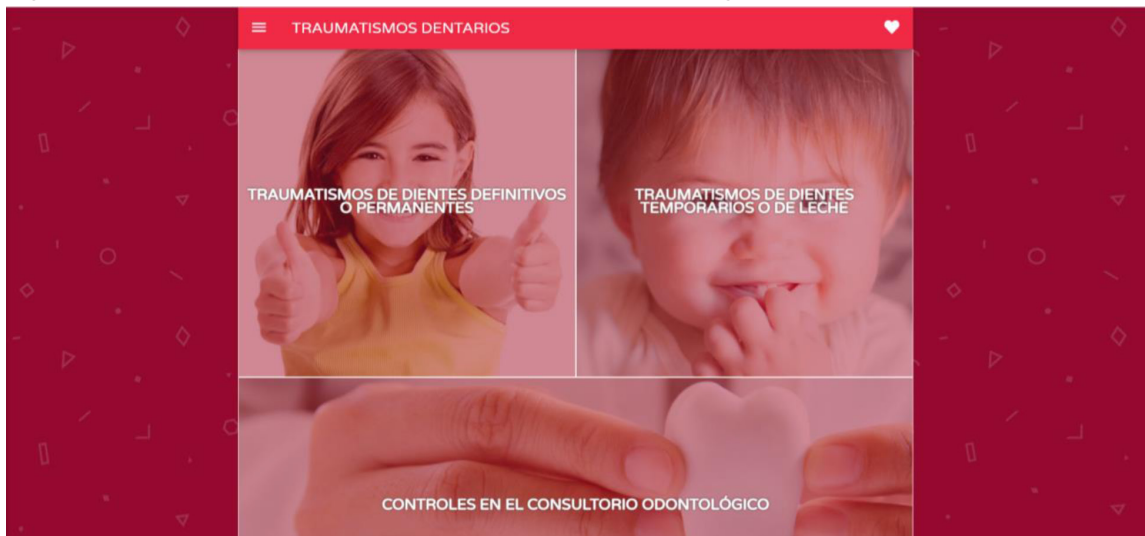
Fig. 4: Indicaciones de acuerdo al tipo de traumatismo dentario según edad