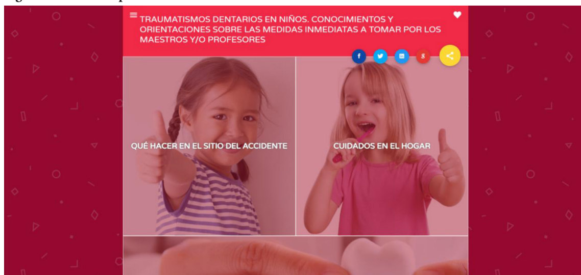
Fig. 3: Carátula de Aplicación Web “Traumatismos dentarios en niños.