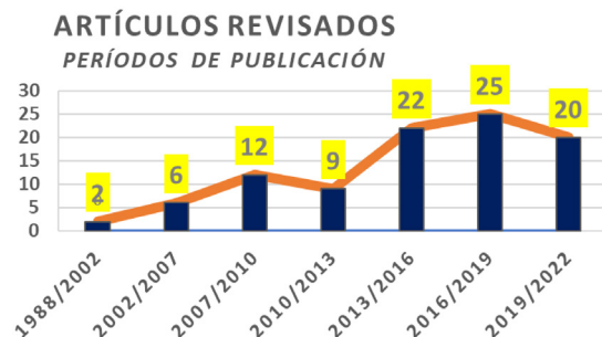
Figura 2: La gráfica muestra el número de trabajos revisados en los diferentes períodos de publicación.

El total de las referencias seleccionadas inicialmente fue de 120. Se descartaron 24 y se analizaron 96, distribuidas según el año de publicación en: 2 (2.1%) con más de 20 años; 6 (6.25%) entre 15 y 20 años; 12 (12.5%) entre 12 y 15 años; 9 (9.4%) entre 9 y 12 años; 22 (22.9%) entre 6 y 9 años; 25 (26%) entre 6 y 3 años y 20 (20.8%) con menos de 3 años. En síntesis, 69.8% (67) de los trabajos revisados tenían menos de 9 años. En la Figura 2 se grafican estos resultados.