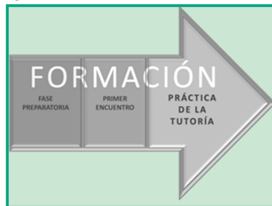
Fig. 1: Momentos del curso TEP

Al culminar la tutoría se solicita al tutor o pareja de tutores que realicen un trabajo final de carácter reflexivo y crítico.